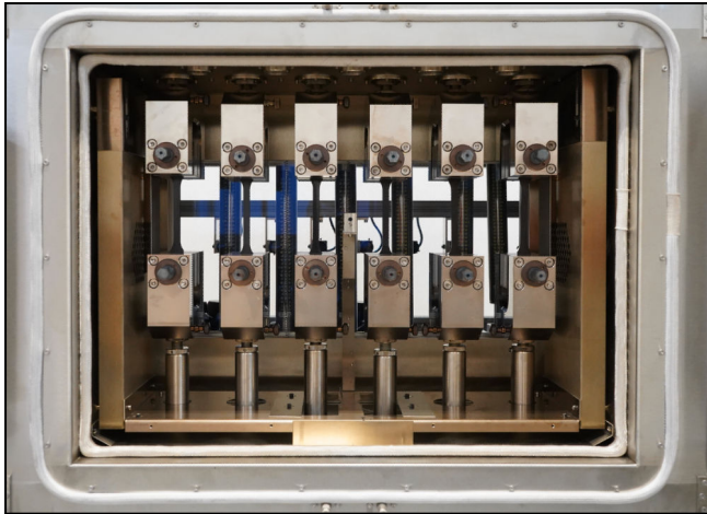
Ein berührungsloses Video-Extensometer je Prüfachse