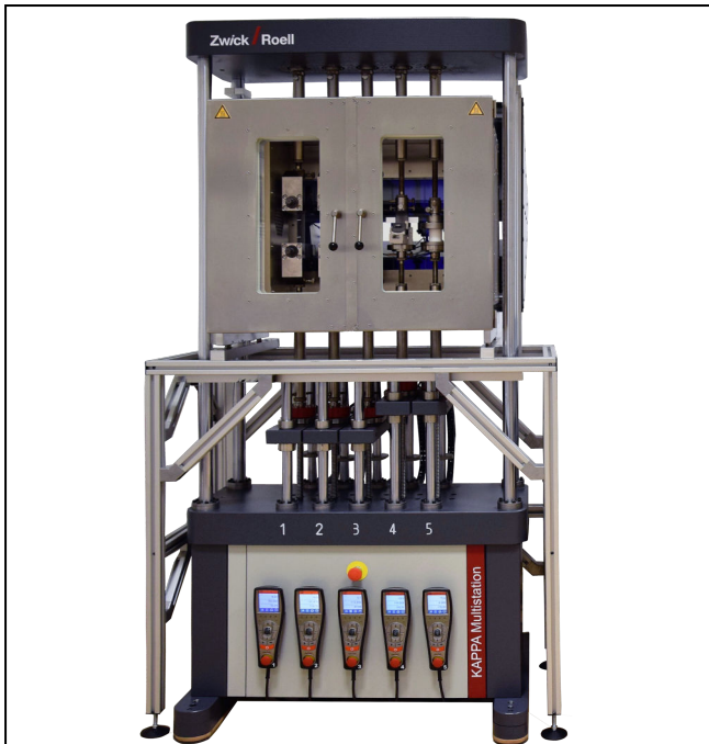
Kappa Multistation mit 5 Prüfachsen