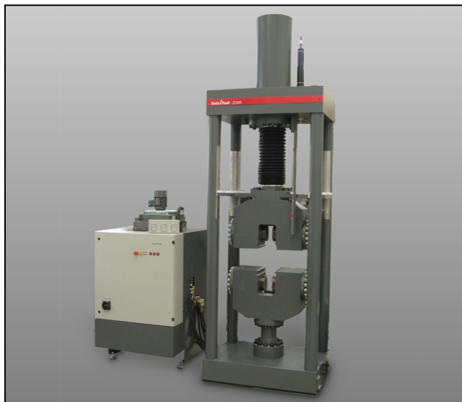
ZwickRoell Z1200H mit Hydraulik-Probenhalter