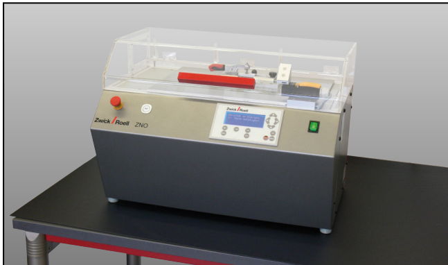
ZwickRoell Kerbfräse ZNO 2010